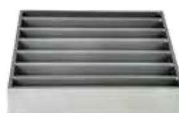
Stabrost – D