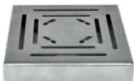
gelochter Blechrast – B