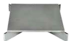
Plattenrost - P